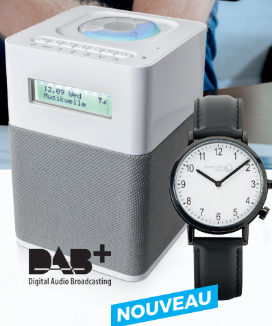
Appareil de base Allegra avec radio et montre d'appel d'urgence Vito

Vivre aussi longtemps que possible chez soi, s'y sentir bien et libre. Élégantes et discrètes, nos montres d'appel d'urgence vous permettent de profiter de la vie en toute indépendance – tout en sachant que vous pouvez compter sur une assistance rapide en cas d'urgence.